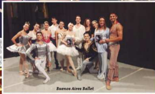
Buenos Aires Ballet